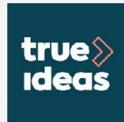
True Ideas B-Corp creative agency