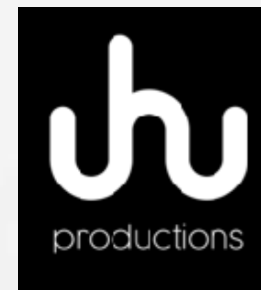
UHU Productions Filmproductiebureau